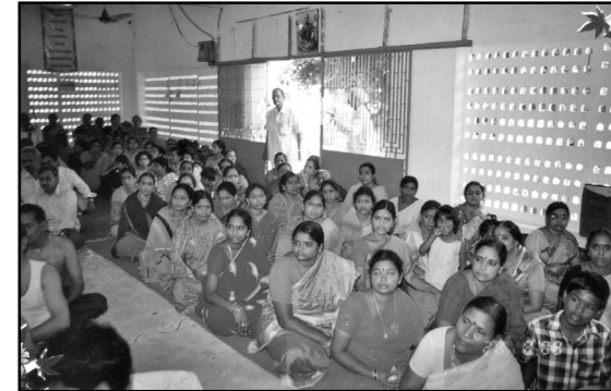
ది. 28-8-2007 శతాబ్ది స్మారక అవిష్కరణ సభలో ఒక భాగము